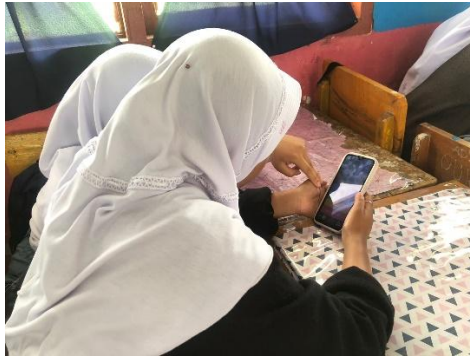
Gambar 2. Siswa menggunakan aplikasi atau platform online selama bimbingan belajar

Dalam minggu pertama, ada kegiatan pengenalan dan aktivitas awal. Kegiatan pertama adalah permainan edukatif, yang bertujuan untuk memperkenalkan konsep dasar Pendidikan Agama Islam (PAI). Seperti, kuis interaktif, yang difasilitasi oleh aplikasi atau platform online, memungkinkan siswa berpartisipasi secara aktif dan bersaing dengan teman setim mereka dan setiap kelompok terdiri dari dua anggota atau teman sebangku mereka. Setelah permainan, siswa dibagi menjadi kelompok kecil untuk berbicara tentang nilai-nilai moral PAI dan hasil kuis. Setiap kelompok juga diminta untuk membuat kesimpulan apa yang mereka pelajari dari permainan dan mempresentasikannya kepada kelas. Siswa belajar tentang nilai-nilai dasar PAI dan pentingnya kerja sama melalui permainan dan diskusi kelompok.