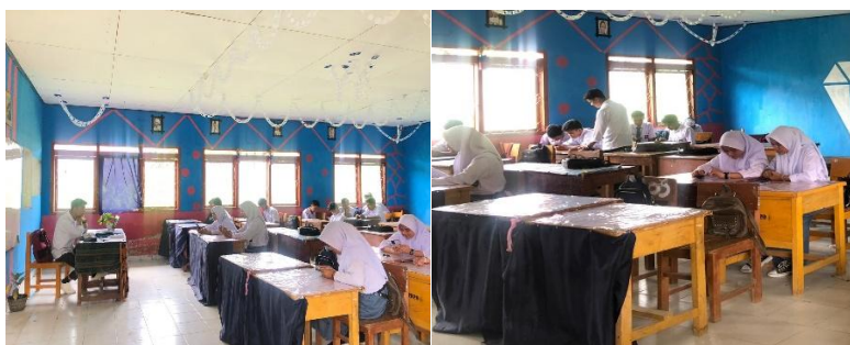
Gambar 2 & 3. Pengawasan dan pendampingan langsung